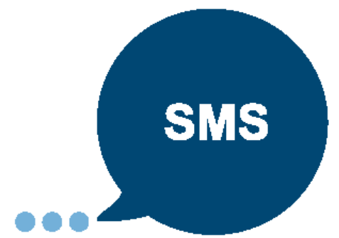
TABLE DE COMANDOS SMS

Especificación de los SMS de mando que se enviarán desde el número de teléfono móvil que has emparejado con la suscripción al (+39) 320.204.32.52 para gestionar el servicio sms sin conexión web al sitio Meteomed.